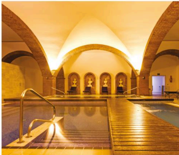
Hotel Blancafort Spa Terma (La Garriga).