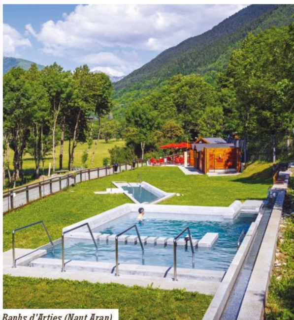
Banhs d'Arties (Naut Aran).

haute montagne : entouré de sommets, de lacs et de rivières, Naut Aran est une perle d'altitude ! En plus d'un époustouflant cadre