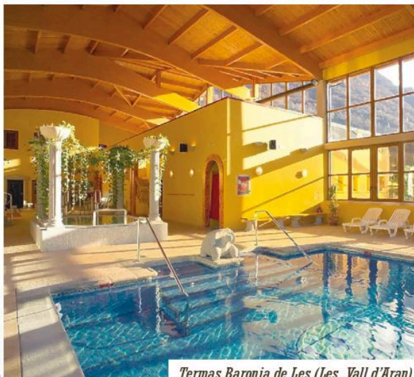
Termas Baronia de Les (Les, Vall d'Àran).