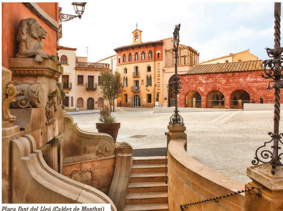
Plaça Font del Lleó (Caldes de Montbui).

Pour ce faire, nous aborderons la question du thermalisme selon le type de tourisme auquel il est lié. Et il se trouve que chacune de ces quatre catégories correspond également à une zone géographique donnée. Partons donc à la découverte des quatre provinces catalanes vues à travers le prisme limpide de leurs eaux thermales !